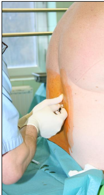
1. kép Spinális érzéstelenítés

Az érzéstelenítőszt befecskendezzük a gerincvelői folyadékba – ezt nevezzük spinális érzéstelenítésnek (1. kép). Az érzéstelenítés megkezdése előtt fertőtlenítő folyadékkal lemoszuk a bőrt a gerinc ágyéki szakaszán, majd a tűszúrás leendő helye körüli bőrfelületet érzéstelenítjük. Ez után kerül sor az injekciós tű gerincvelői folyadékba történő bevezetésére. A gerincoszlop azon részén, ahol gerincvelő már nem található, csak gerincvelői folyadék. Spinális érzéstelenítés esetén a test deréktól lefelé érzéketlenné válik.