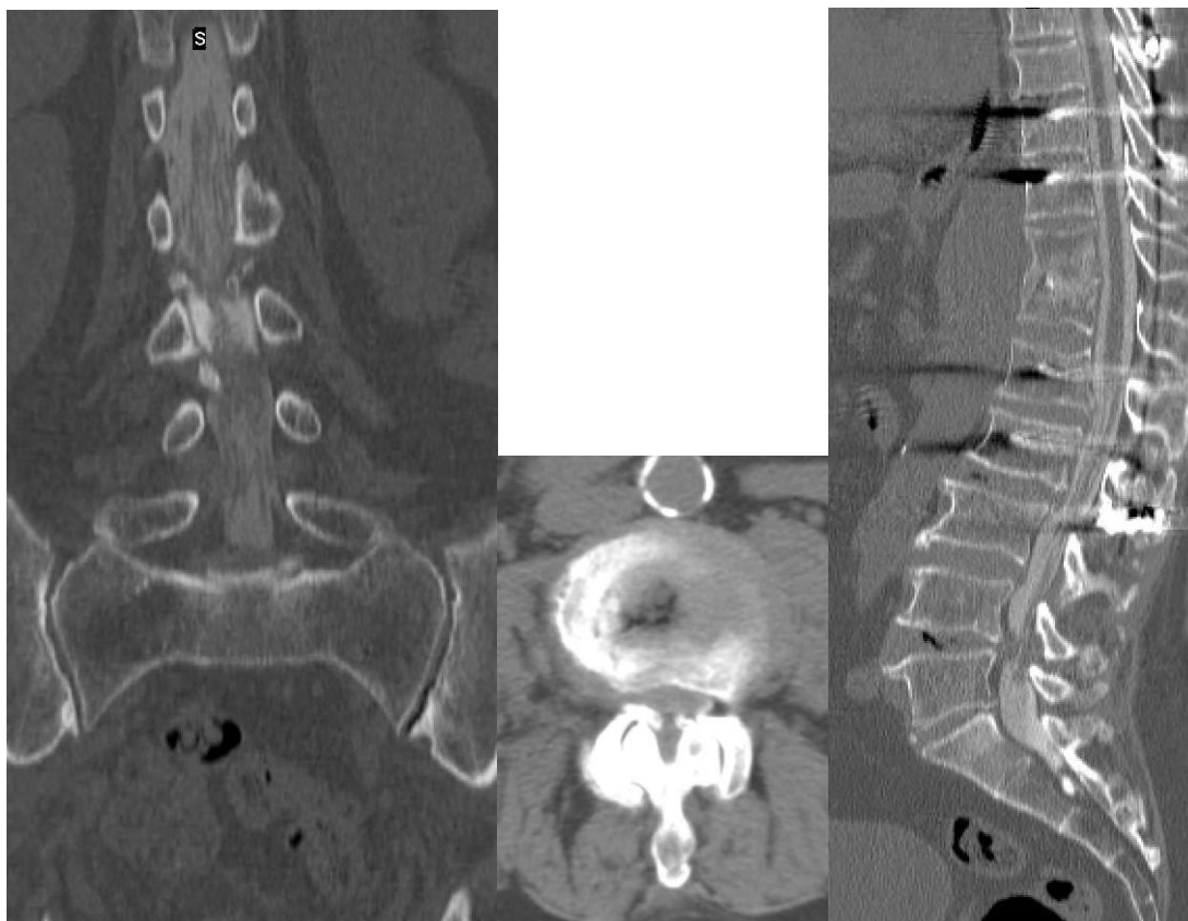
4-6. ábra Mielográfia után készült CT vizsgálat képei: előlről, haránt, oldalról